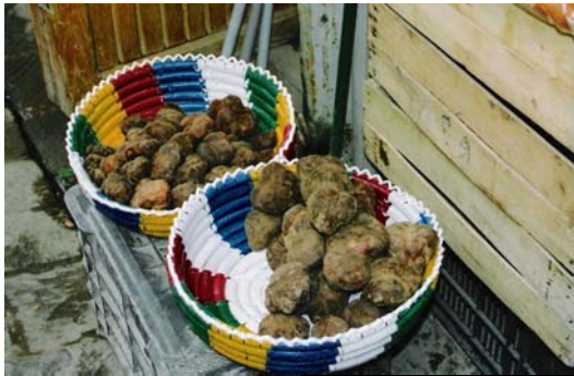
Les Truffles du Désert