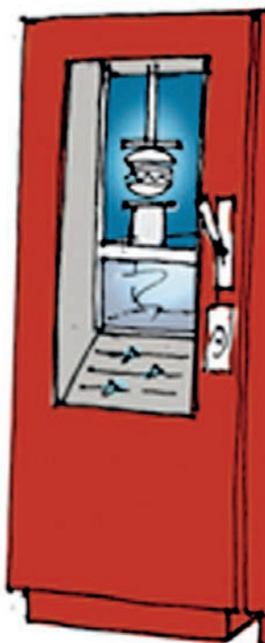
MESURE SUCRE, HUILE, SEL.